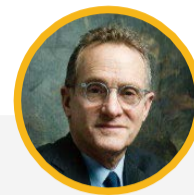
霍華德·馬克斯 橡樹資本 危機投資/91億美元

基金管理規模截至2023/3/31，來自美國證券交易委員會的13F持倉報告，圖片來自公開資訊，元大投信整理，2023/7。