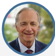
雷·達里奧 橋水基金 全球總經/164億美元