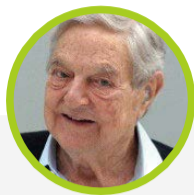
喬治·索羅斯 索羅斯基金 絕對報酬/65億美元