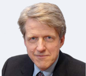
耶魯大學經濟學 羅伯·席勒 教授 Professor Robert J. Shiller